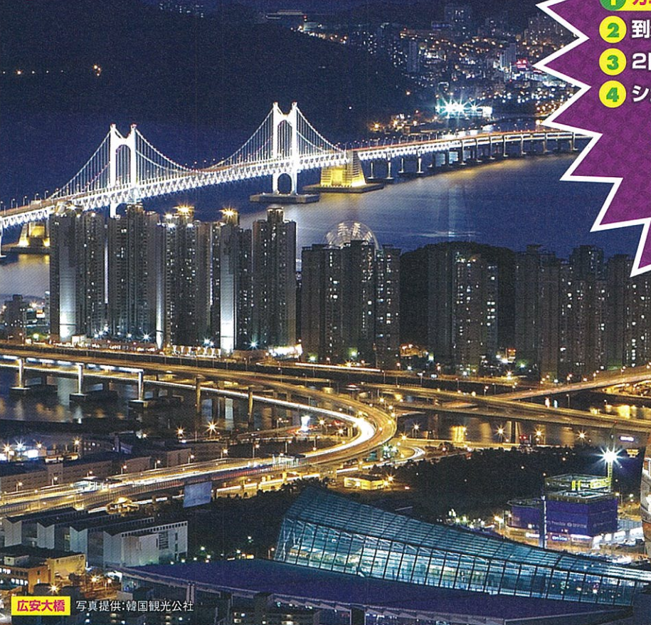
広安大橋